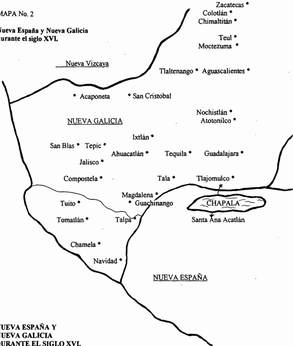
NUEVA ESPAÑA Y NUEVA GALICIA DURANTE EL SIGLO XVI.