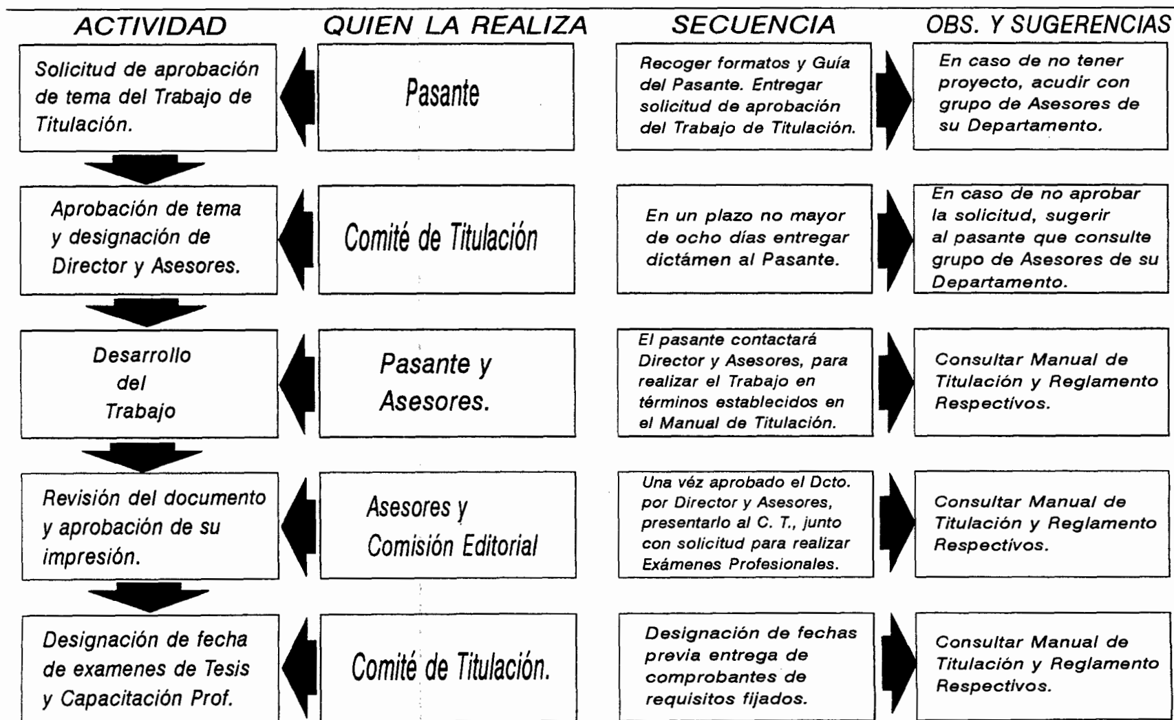
Figura 1. Flujograma para la Titulación.